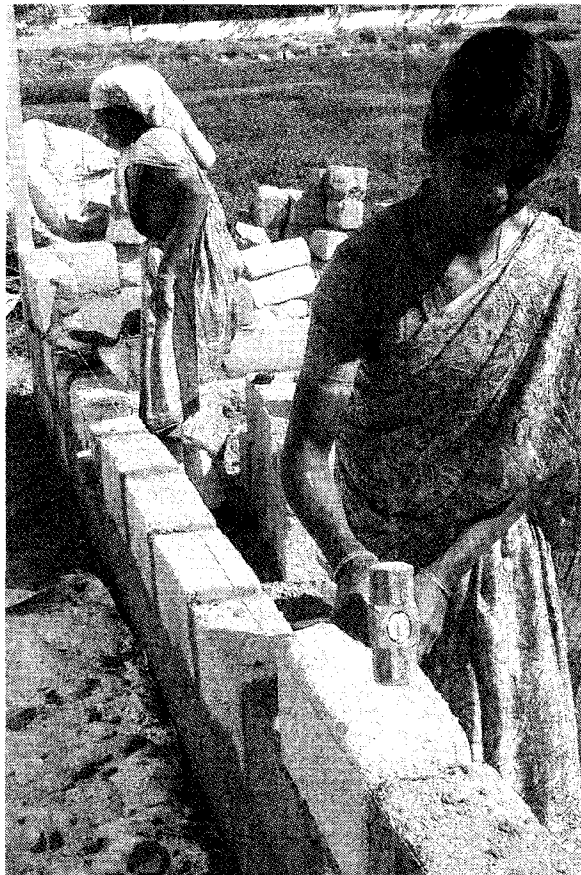
Stein auf Stein: Die Frauen haben in diesem Jahr bereits das zweite Haus (fast) fertig gestellt.

„Ich habe Frauen aus den Slums als Maurer angelernt“, sagt er.