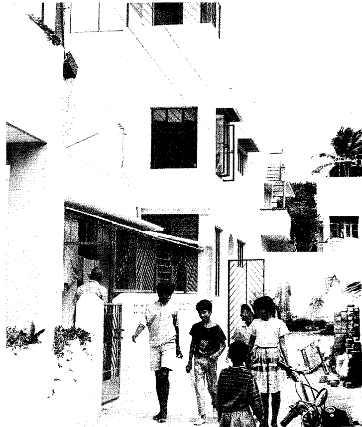
Das Gebäude des Shishu-Mandir-Kinderheims