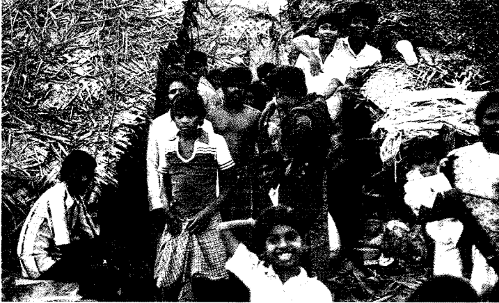
Eine nachbarliche Gemeinschaft im Slum