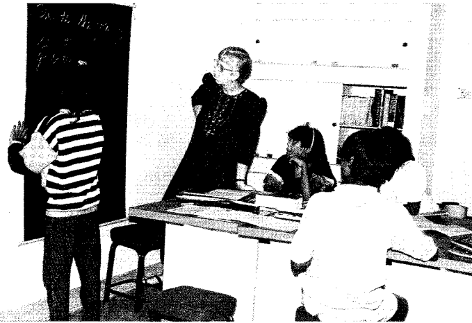
Englischunterricht der Fünftklässler

Konto: Shishu Mandir – Zukunft für Kinder e.V. Deutsche Bank Mönchengladbach Nonto-Nr. 760 21 21 BLZ 310 700 24