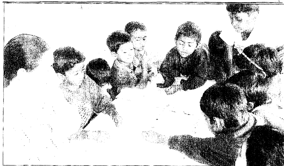
Spiele spielen, das macht Spaß – die Betreuerinnen kümmern sich rührend um die Bedürftigen.